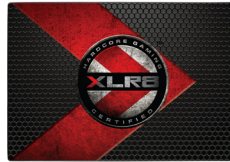
CS2211 Gamer/Enthusiast SSD